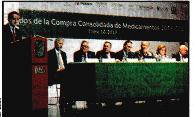
Mikel Arriola, director del IMSS, presentó los principales resultados de la compra consolidada de medicamentos, en la que se ahorraron más de 3 mil 350 millones de pesos.