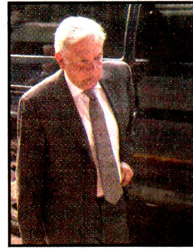
Andrés Manuel López Obrador.