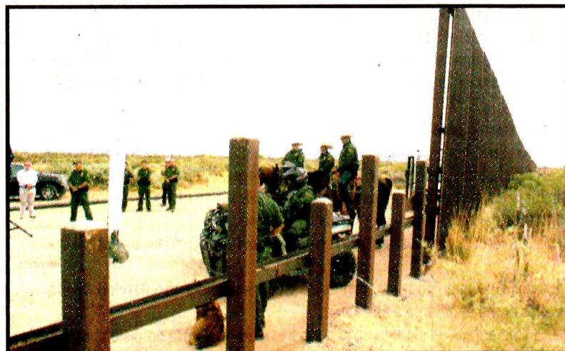
NUEVO MÉXICO, EU.- La patrulla fronteriza vigila la renovación de al menos 30 kilómetros de muro