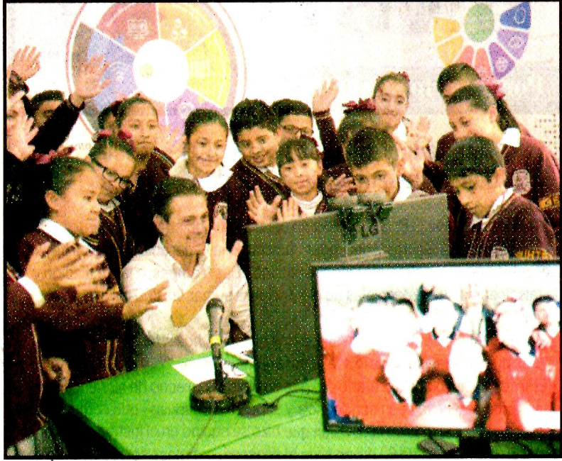
TEPOTZOTLAN, Méx.- Enrique Peña Nieto. Como se defendió la soberanía.