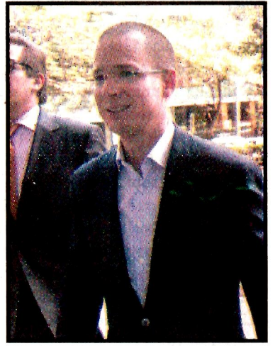
Ricardo Anaya Cortés.