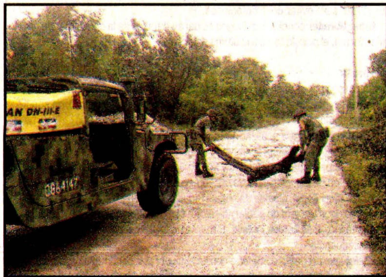
CANCUN, Quintana Roo.-Elementos del Ejército y autoridades estatales y municipales trabajan por el huracán.