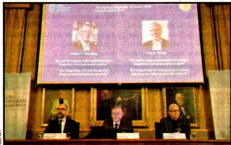
ESTOCOLMO, Suecia.- William Nordhaus y Paul Romer, estadounidenses. Crecimiento económico y medio ambiente, su trabajo.