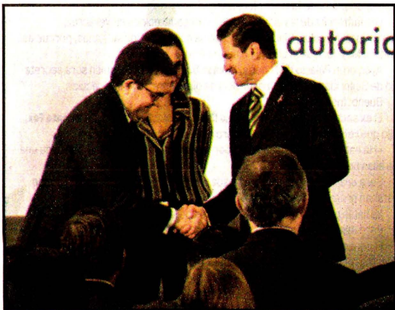
Enrique Peña Nieto e Ildefonso Guajardo. 25 Años de la Autoridad de Competencia en México.