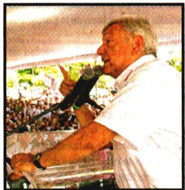
ZAPOPAN, Jal.- Andrés Manuel López Obrador.

entidad tan lacerada por la violencia que vivimos diario", agregó. Dijo que el prelado no ha hecho mal y sólo ha acudido en calidad de