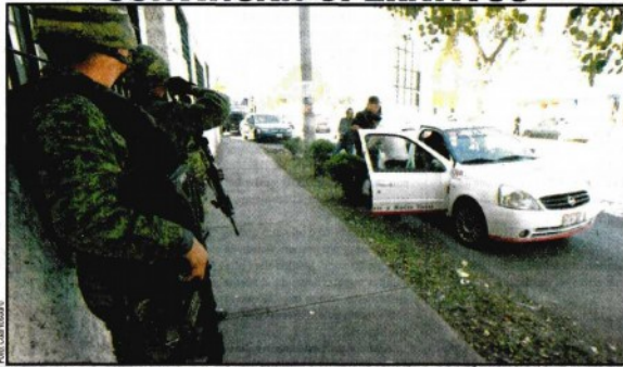
El Ejército Mexicano refuerza la vigilancia en los estados más asolados por la delincuencia.