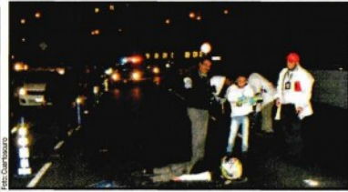
Dos jóvenes que viajaban en motocicleta cayeron del segundo piso del Periférico y perdieron la vida, en el sur de la Ciudad de México.