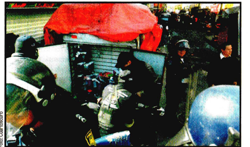
Operativo en la Plaza de la Tecnología para detectar teléfonos celulares y computadoras robados. Hay siete personas detenidas. Ver página 6