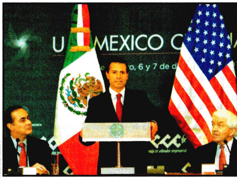
Enrique Peña Nieto. Encuentro con el U.S.-México CEO Dialogue.

Explicó que esta inversión permitirá la generación de 10 mil