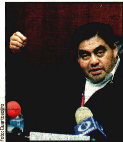
Miguel Barbosa Huerta.

Luego de que conocer la resolución del PRD nacional, Miguel Barbosa consideró que la medida es un golpe al grupo parlamentario.