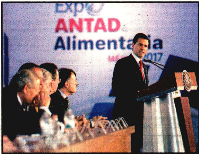
GUADALAJARA, Jal.- Enrique Peña Nieto. Inauguración de la Expo ANTAD y Alimentaria 2017.

“Mi punto es que arreglar el TLC, no va a generar cargas para México. Habrá buenos aspectos que saldrán y estamos tratando de corregir el beneficio marginal para Estados Unidos, corregir algunos defectos originales e incluso crear nuevas oportunidades para los negocios estadounidenses y reducir nuestro déficit comercial”, detalló.