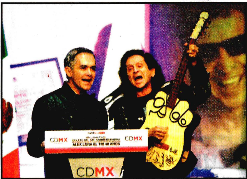
Palomazo de Miguel Ángel Mancera y Alex Lora, del Tri. Boleto del Metro por 48 años de la banda. El mandatario desechó la polémica en la Constitución de la CDMX con la plusvalía en inmuebles. Ver página 11