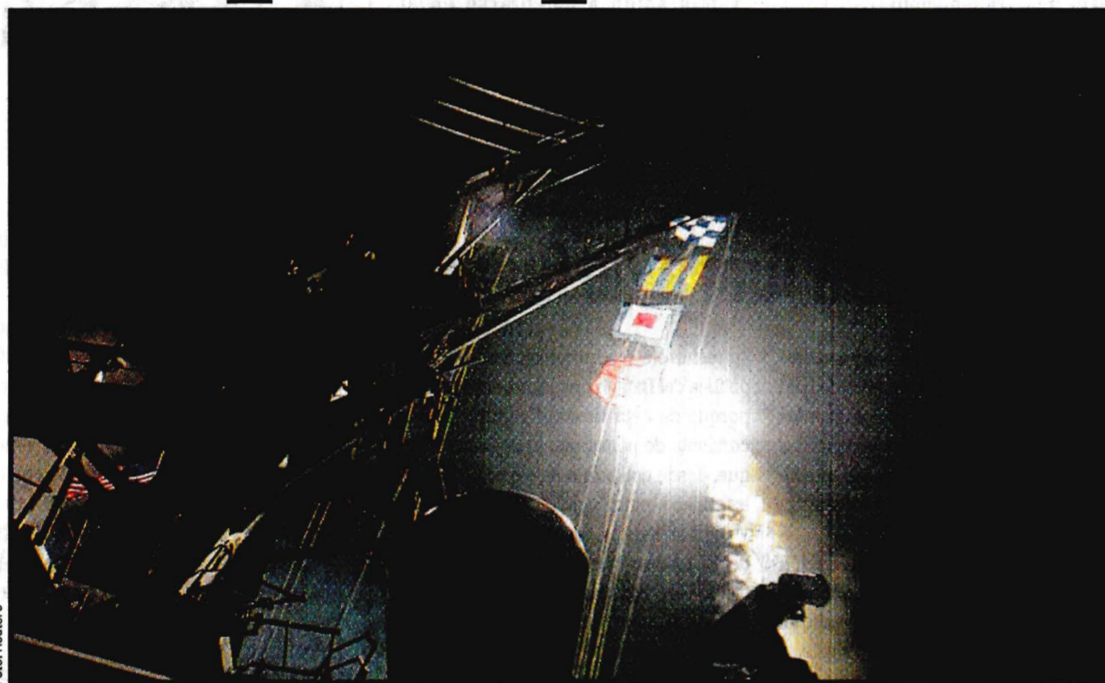
SIRIA.- Respuesta del presidente republicano, luego del ataque con armas químicas contra civiles en Siria.

Funcionarios de la Casa Blanca dijeron que Trump le informó