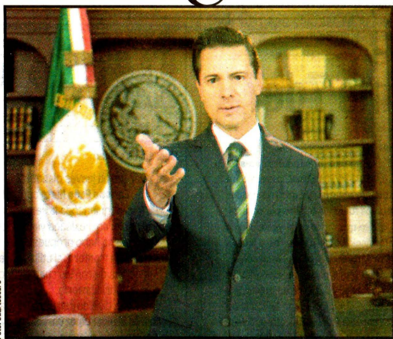
Enrique Peña Nieto. Respuesta contundente.