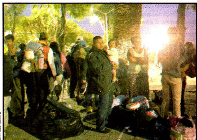
PUEBLA, Puebla.- La caravana de migrantes de Centroamérica llegó a esta ciudad. Casi disuelta planea arribar a la CDMX y desintegrarse.