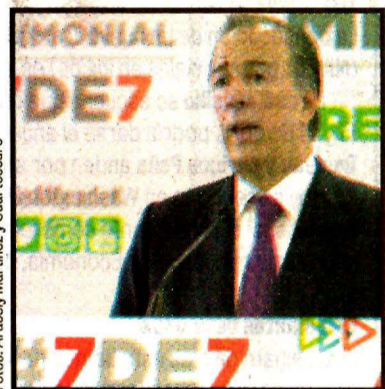
José Antonio Meade. Su 7de7