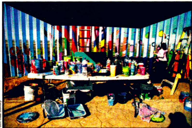
TIJUANA, BC.- Artistas voluntarios embellecen el oxidado muro fronterizo que divide a Estados Unidos de México, en la playa.