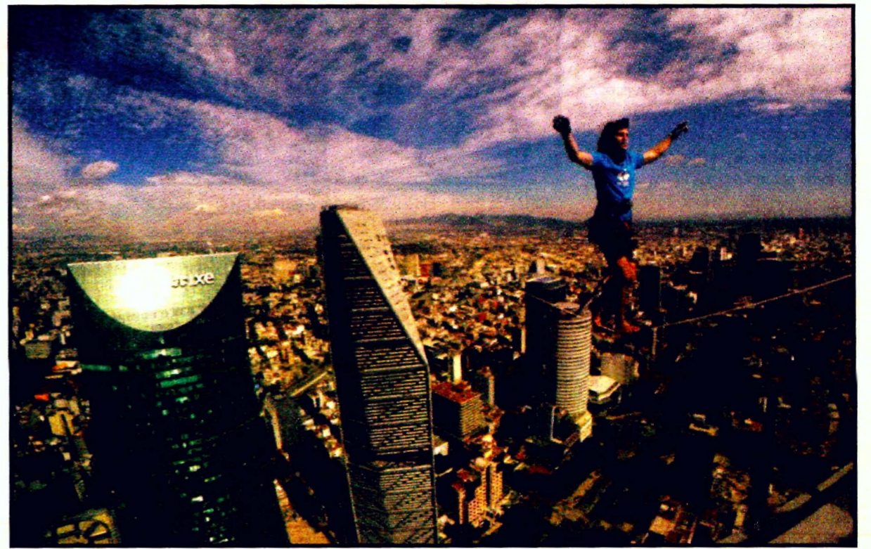
El alemán Alexander Schulz impuso un nuevo récord de highline en la Ciudad de México, al caminar sobre la cuerda floja y sólo con dos arneses de protección, 217 metros a 246 metros de altura. El cable estaba sujeto de la Torre Bancomer a la Torre Reforma.