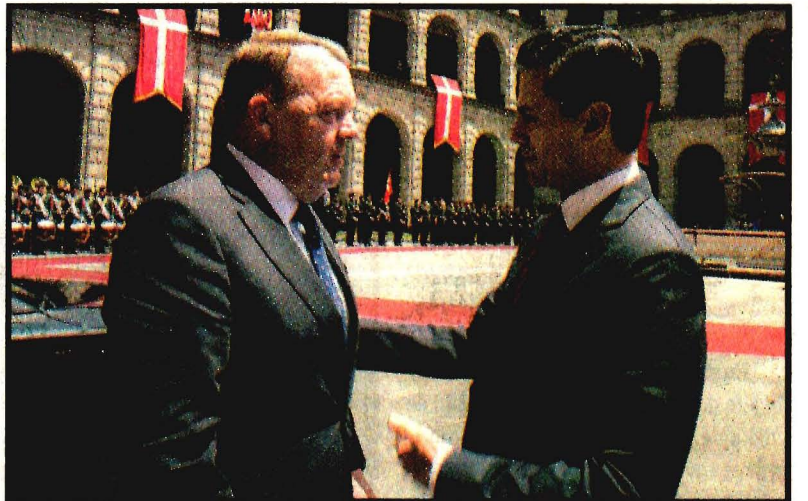
Enrique Peña Nieto y Lars Lokke Rasmussen, primer ministro de Dinamarca. Recepción en Palacio Nacional. México es un destino confiable y despierta interés a otras naciones, dijo el mandatario.