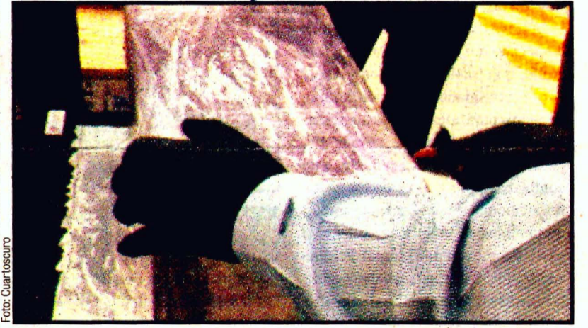
Son 120 kilogramos, que en el mercado negro se cotizan hasta en 76 millones de dólares.