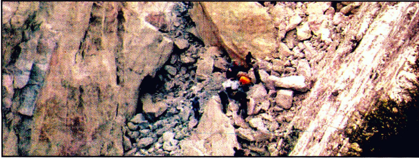
FRANCISCO I. MADERO, Hidalgo.- Derrumbe en una mina ejidal de granito. Hasta anoche sólo habían recuperado tres cuerpos.