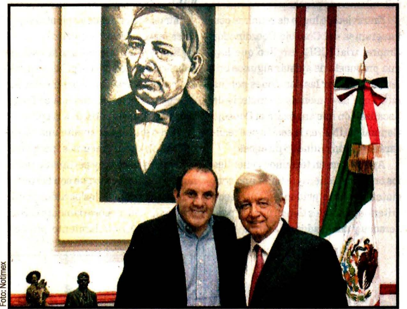
Andrés Manuel López Obrador y Cuauhtémoc Blanco. Visita del gobernador electo de Morelos a la casa de transición.