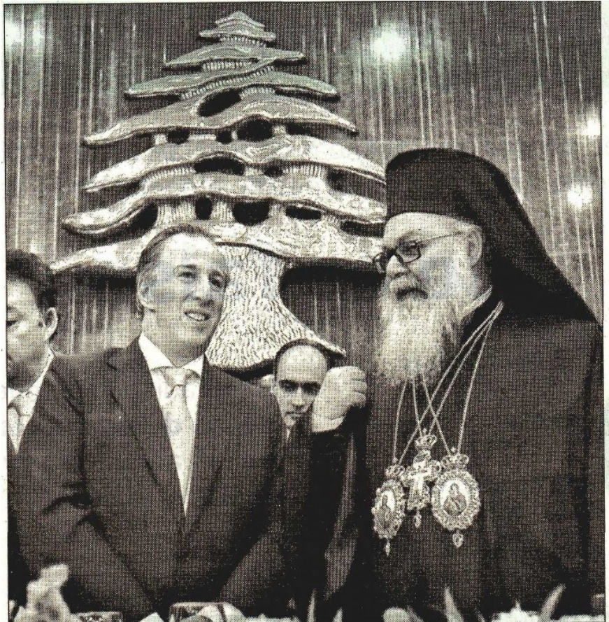
El secretario de Hacienda, José Antonio Meade Kuribreña, y Juan X, patriarca de Antioquia y de todo el Oriente, máxima autoridad de la Iglesia ortodoxa, ayer en el Centro Libanés, adonde el funcionario acudió a una comida en representación del presidente Enrique Peña Nieto