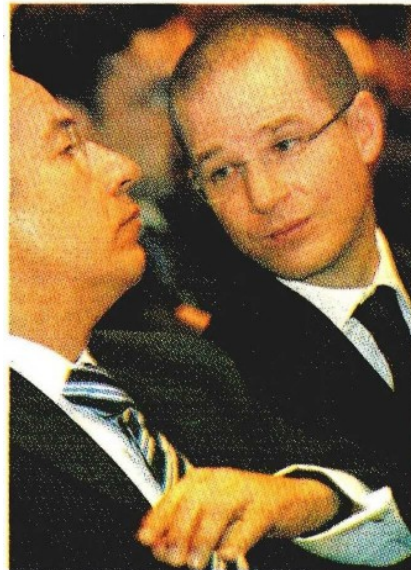
El ex presidente y el líder del blanquiazul.