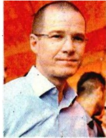
Ricardo Anaya, dirigente panista