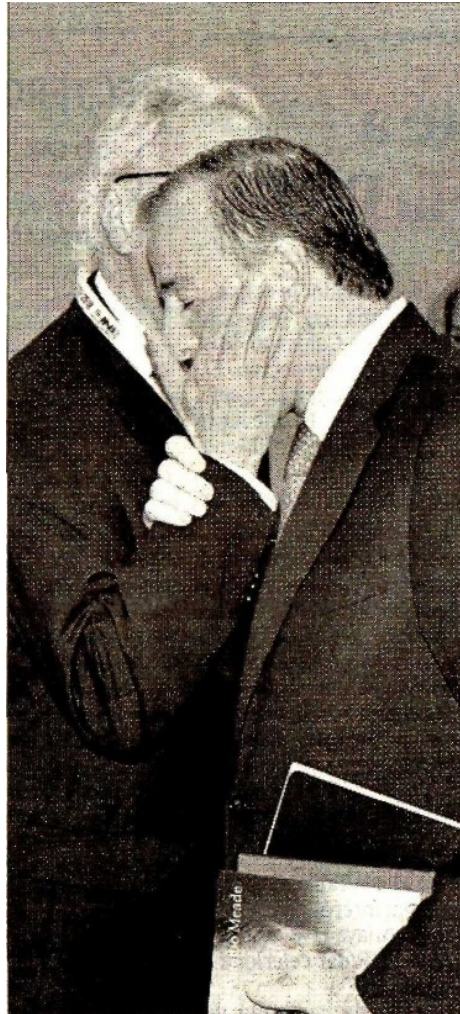
▲ El candidato de Juntos Por México (PRI, PVEM y Panal), José Antonio Meade, con su padre, Dionisio Meade y García de León, antes del inicio del tercer debate presidencial realizado ayer en Mérida, Yucatán.