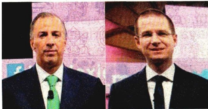
José Antonio Meade y Ricardo Anaya

Quien haya visto el debate en el extranjero podría pensar que México está condenado a tener un presidente corrupto, pues los tres principales candidatos se acusaron de actos de corrupción y dos de ellos se amenazaron con cárcel. José Antonio Meade dijo a Ricardo Anaya que será indiciado por lavado de dinero. Anaya reviró acusando a Meade de corrupción y advirtió que de ganar la elección buscará encarcelar al presidente Enrique Peña Nieto . Don Andrés Manuel López Obrador dijo que él no metería a la cárcel "ni" a Anaya, pues él busca justicia no venganza. Sin embargo, Anaya lo acusó de favorecer a un empresario con contratos millonarios durante su gestión como jefe de Gobierno de la capital del país. Es decir, según ellos mismos, ninguno estaría a salvo de ser llevado ante la justicia por actos de corrupción. Nos hacen ver que las amenazas, especialmente entre Meade y Anaya, sonaron muy reales, por lo que la pelea podría no terminar con la elección. ¿Y usted por quién votará?