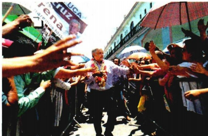
AMLO, este jueves, en el municipio de Pánuco, Veracruz