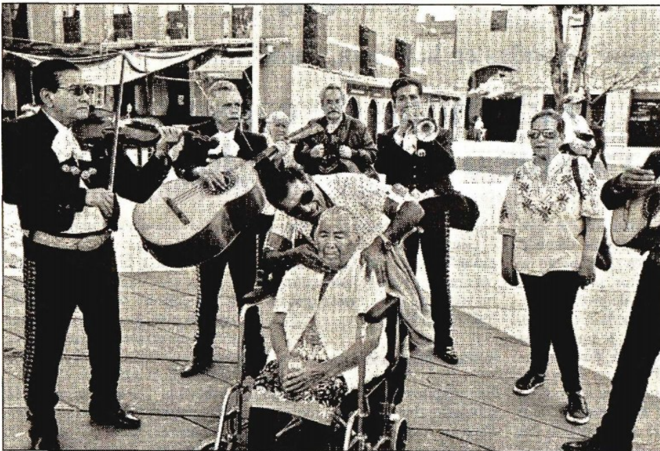
Desde 1922, en México se festeja a las madres el 10 de mayo. Ayer, mientras algunas celebraron con sus familias en casa o en sitios públicos, otras marcharon del Monumento a la Madre al Ángel de la Independencia, en la capital del país, para exigir la aparición de sus hijos. “¡Vivos se los llevaron, vivos los queremos!”

Fax: 5605-2099 • juliohdz@jornada.com.mx • Twitter: @julioastillero • Facebook: Julio Hernández