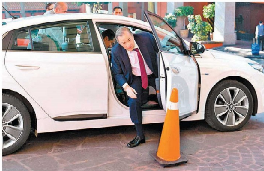
El candidato presidencial por la coalición Todos por México.