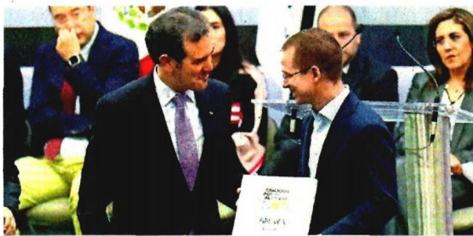
Lorenzo Córdova y Ricardo Anaya, el domingo, en el INE

Con tremenda celeridad, el Instituto Nacional Electoral, encabezado por el consejero Lorenzo Córdova , determinó otorgar medidas cautelares al candidato presidencial panista, Ricardo Anaya , frente a un desplegado publicado por el PRI en distintos diarios del país para señalar al joven político por realizar acciones de lavado de dinero y de enriquecimiento ilícito. En unos cuantos días, nos comentan, el INE envió requerimientos a los medios de comunicación para que le informaran quién o quiénes habían ordenado la inserción del desplegado publicado entre el jueves y el viernes de la semana pasada, y, por supuesto, quién o quiénes lo habían pagado. Y, en cuestión de días, los integrantes de la Comisión de Quejas y Denuncias del INE ordenaron a la dirigencia priísta la suspensión del desplegado y que se abstenga de contratar otros espacios publicitarios. El trato dispensado a Anaya contrasta con otras quejas y con la recepción que le dieron el domingo en el instituto para la solicitud de registro como aspirante a Los Pinos. Y si no, pregúntele usted a Margarita Zavala , a quien apenas le dieron acceso a un pequeño espacio después de realizado el trámite. ¿Córdova se viste de azul?