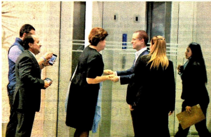
Ricardo Anaya, candidato de la coalición Por México al Frente.