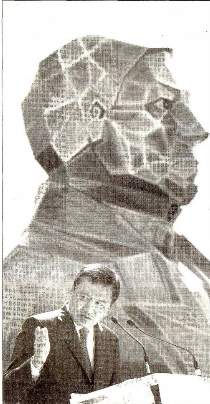
Miguel Ángel Osorio Chong se despidió ayer de los funcionarios y trabajadores de la Secretaría de Gobernación, que encabezó desde el inicio del sexenio. Cinco años más tarde va en busca de un lugar en el Senado. El político hidalguense prefirió no ser explícito en el adiós