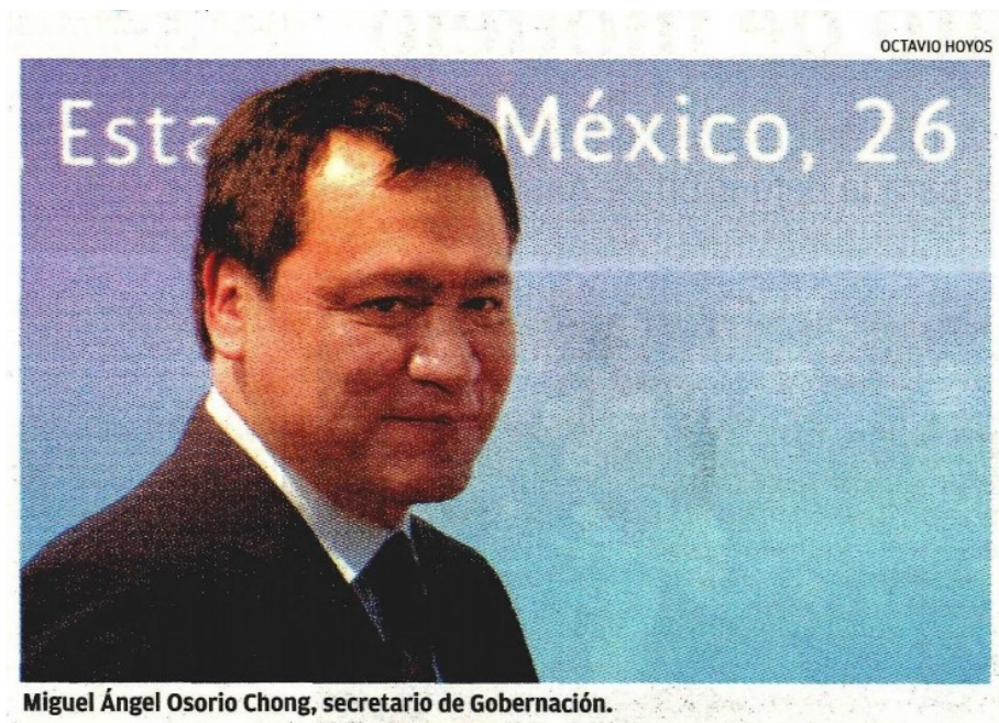
Miguel Ángel Osorio Chong, secretario de Gobernación.