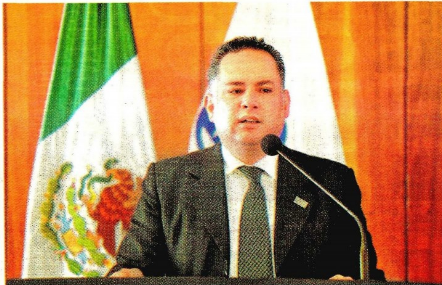
El funcionario fue removido de la fiscalía por trasgredir el código de conducta de la PGR.