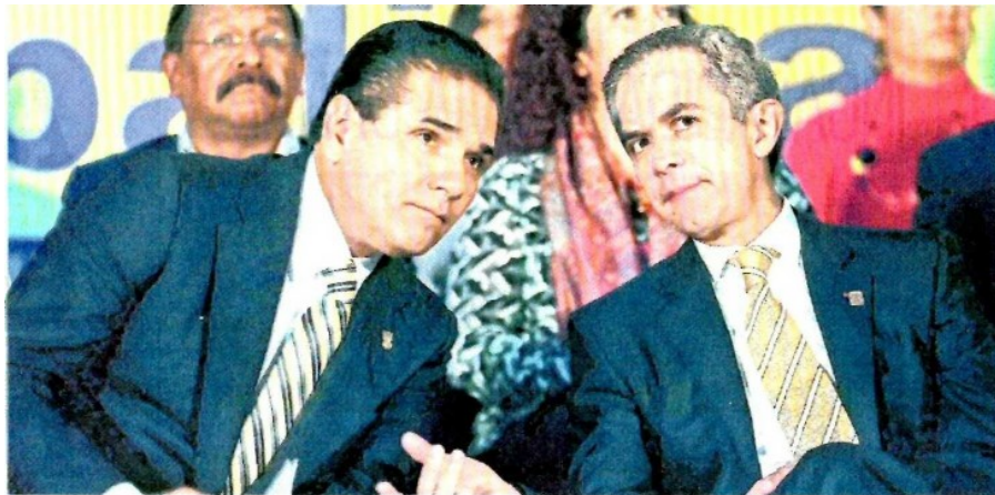
Silvano Aureoles y Miguel Ángel Mancera

En privado, el presidente Enrique Peña Nieto se toma con humor aquella frase de “faltaba un minuto, no menos, 5 minutos”. El mandatario invitó ayer al senador Ernesto Cordero —quien lo acompañó a la clausura de la 108 Asamblea General del IMSS en Aguascalientes— a la parte trasera del avión presidencial, para que conociera completa la aeronave. Ahí, el Presidente señaló al responsable de provocar ese me-me y rió por completo. El día que se originó ese bullying en redes contra el mandatario, éste fue a la cabina donde viajan los periodistas que lo acompañan. Ahí hubo un diálogo muy rápido sobre cómo estaban las familias de los informadores tras el sismo del 19 de septiembre. Peña Nieto recordó que estaban a punto de aterrizar en la Base Aérea de Ixtepec, Oaxaca. “Estamos a diez minutos”, le dijo un reportero, el Presidente le respondió “no a un minuto”, otro diarista le atajó, “como a 10 minutos”, el Presidente respondió de inmediato, “no menos a cinco minutos”. El diálogo fue muy rápido y las voces de los periodistas no fueron captadas por las cámaras y teléfonos, por lo que al escucharlas parecía un razonamiento exclusivo del Presidente. Hoy, Peña Nieto ríe cuando mencionan el uno, “no menos a cinco” que lo hizo viral en las redes sociales.