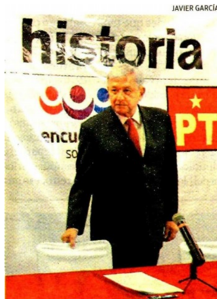
Andrés Manuel López Obrador.

En algún lado hay muchos desesperados. Ahora resulta que echaron a circular en redes la tontería de que Miguel Osorio sigue enojado y que, por eso, el PAS se alió a Morena. No conocen la lealtad de Osorio y menos al oportunista PAS. M