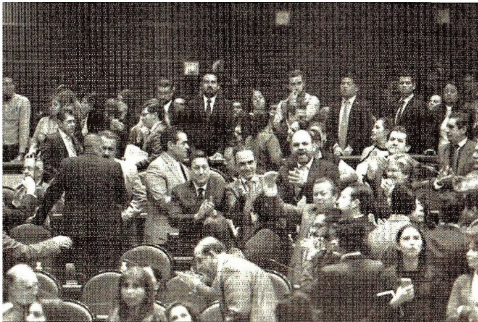
La bancada priísta festeja en San Lázaro la aprobación en lo general del Presupuesto de Egresos de la Federación 2018, con una ampliación de 80 mil millones de pesos, de los cuales sólo 18 mil millones se destinarán a la reconstrucción tras los terremotos de septiembre

Fax: 5605-2099 • juliohdz@jornada.com.mx • Twitter: @julioastillero • Facebook: Julio Hernández