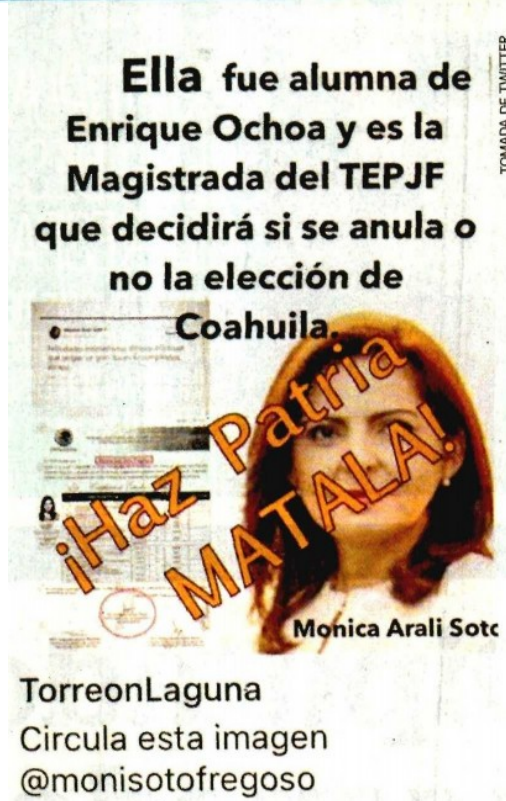
Post donde se incita a “matar” a magistrados del TEPJF

Mucho cuidado deben tener las dirigencias de los partidos políticos para evitar que la rivalidad electoral se transforme en violencia. Nos dicen que desde el Poder Judicial se observa con preocupación cómo ha escalado el tono de las propuestas en contra de las autoridades electorales, luego de algunos de los fallos adversos en el caso de la elección de Coahuila, en la que buscan que se anule el triunfo de priísta Miguel Ángel Riquelme . Observan que se ha pasado de las marchas y la convocatoria a la ingobernabilidad, como medios de presión, a la descalificación —desde la página del CEN del PAN— de los magistrados electorales, y los llamados en redes sociales de supuestos simpatizantes panistas a “matar” a los juzgadores. Preocupante.