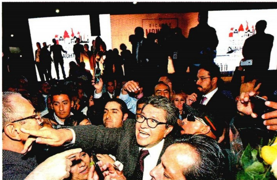
El jefe delegacional de Cuauhtémoc, Ricardo Monreal, en su segundo informe de labores.