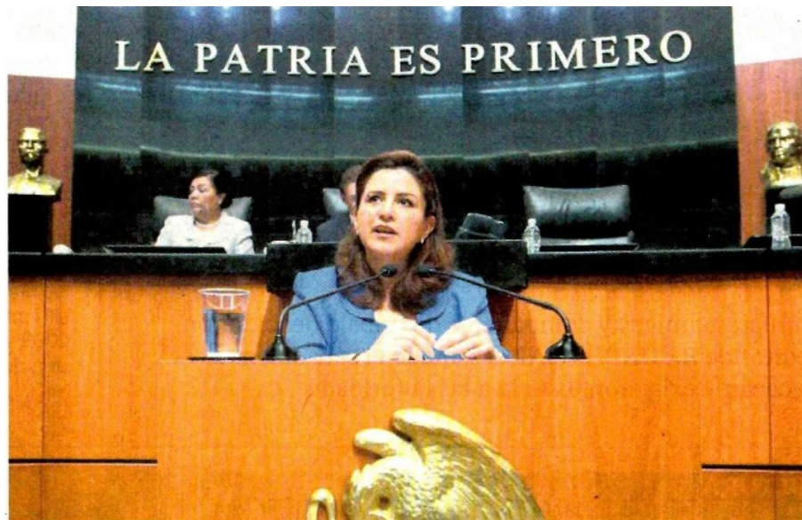
Martha Angélica Tagle Martínez, senadora de la República