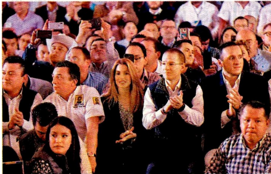
Ricardo Anaya, precandidato a la Presidencia por la coalición Por México al Frente.