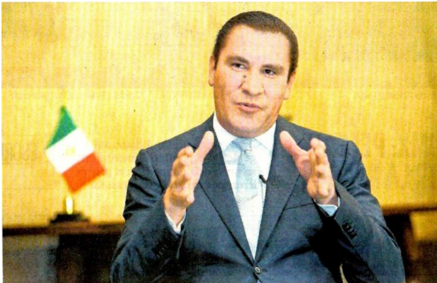
Rafael Moreno Valle, ex gobernador de Puebla

Vaya reacción la que causó ayer el senador panista Javier Lozano , quien desde su cuenta de Twitter escribió que le tomó por sorpresa la decisión del ex gobernador de Puebla, Rafael Moreno Valle , de declinar su aspiración presidencial a favor de su líder nacional, Ricardo Anaya . “Por lo visto, no estoy en su ‘equipo de trabajo y colaboradores’ pues hasta ahora me entero de esta decisión. Ya veremos los saldos de su ‘negociación’”, escribió Lozano Alarcón con un tono de reclamo al panista. Lozano tiene la aspiración de ser candidato del PAN para la elección a la gubernatura de Puebla, pero con el virtual alejamiento de Moreno Valle, ese objetivo más bien huele a ruptura, porque la esposa de quien declinó —literalmente— sus aspiraciones a favor de Anaya, Martha Erika Alonso , apenas el sábado confirmó lo que era un secreto a voces: que va por la candidatura al gobierno poblano con las siglas del PAN.