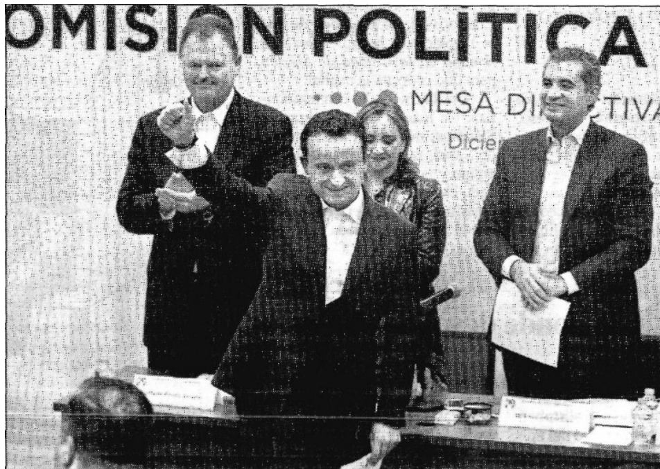
Mikel Arriola, ex titular del IMSS, entregó la documentación para obtener su registro como precandidato del Partido Revolucionario Institucional (PRI) al Gobierno de Ciudad de México. Entre los priístas que recibieron los papeles estaban Ernesto Gándara, Claudia Ruiz Massieu y Enrique Ochoa Reza, presidente del tricolor