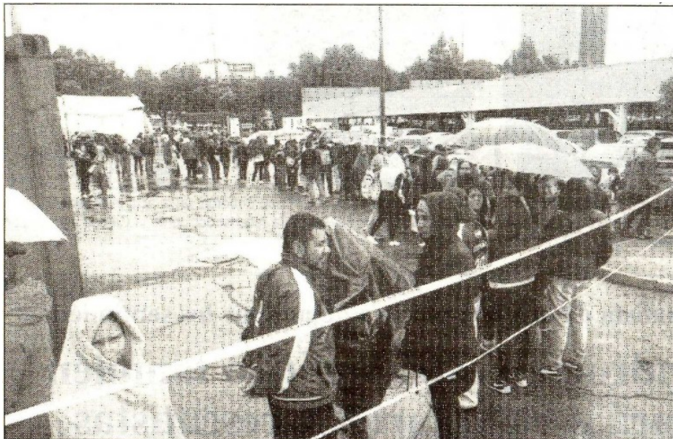
Desde la madrugada, personas damnificadas por el sismo del 19 de septiembre realizan largas filas en un centro comercial, bajo pertinaz lluvia, para recibir la ayuda de 3 mil pesos que ofreció el Gobierno de la Ciudad de México

Fax: 5605-2099 • juliohdz@jornada.com.mx • Twitter: @julioastillero • Facebook: Julio Hernández