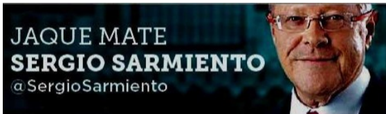
JAQUE MATE SERGIO SARMIENTO @SergioSarmiento

El PRI da una sopa de su propio chocolate a los otros partidos con pancartas y más pancartas.