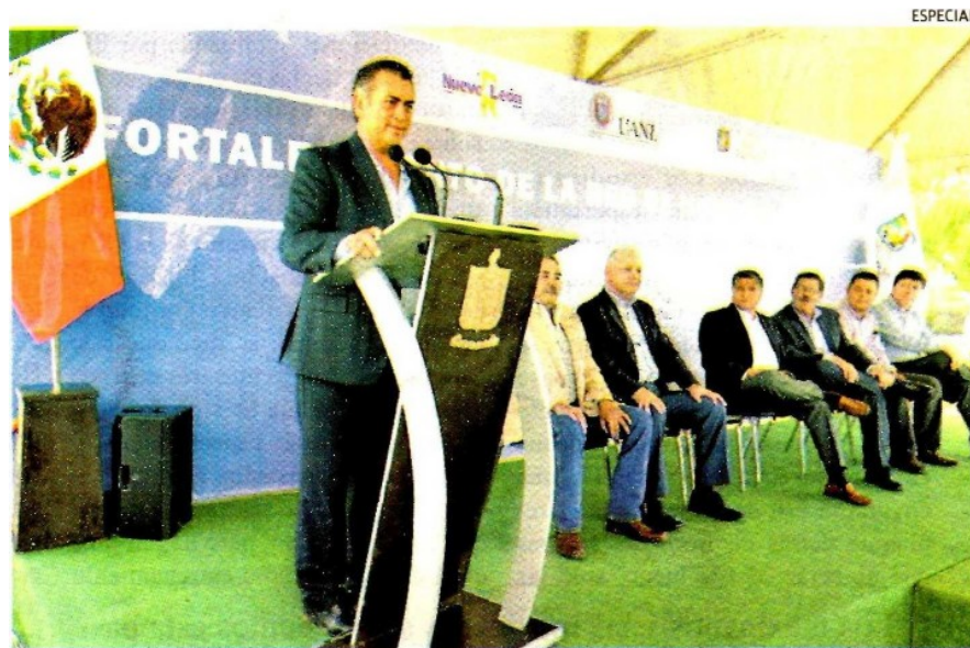
El gobernador de Nuevo León, en un acto ambientalista.