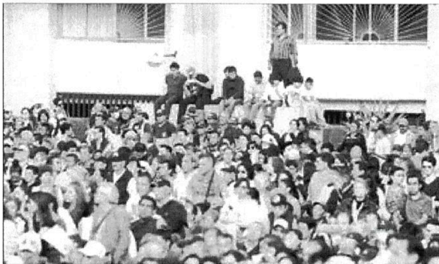
▲ Ante niños, jóvenes y adultos, el presidente Andrés Manuel López Obrador dijo sentirse muy conmovido de arrancar en la Plaza de las Tres Culturas de Tlatelolco el programa de becas para 300 mil estudiantes de nivel superior de familias de escasos recursos. Prometió que en su gobierno no habrá más "rechazados".