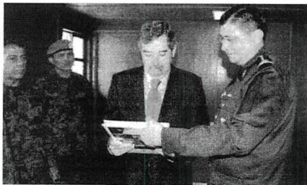
Juan Ramón de la Fuente y el general Sandoval

El doctor Juan Ramón de la Fuente , embajador de México ante la ONU, y el general secretario de la Defensa Nacional, Luis Crescencio Sandoval , visitaron el Centro de Entrenamiento Conjunto de Operaciones de Paz en México. Nos adelantan que hay un interés por incrementar la participación con las Naciones Unidas en diversos programas de adiestramiento, con énfasis en la protección de los derechos humanos. Hacia finales de 2019, nos explican, el Centro que ampliará sus instalaciones y la oferta de cursos y programas será certificado como Centro Colaborador de la ONU en programas para el mantenimiento de la paz. ¡Enhorabuena!