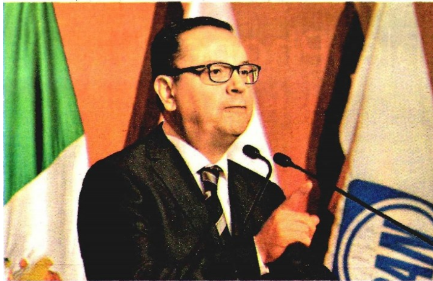
Germán Martínez Cázares, ex dirigente panista.