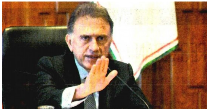
Miguel Ángel Yunes Linares, gobernador de Veracruz