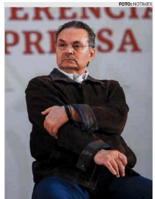
● OCTAVIO ROMERO . La baja nota en Pemex se suma a un entorno de desconfianza.

LA BAJA EN LA CALIFICACIÓN PAÍS, PEMEX Y CFE VA A GENERAR MAYORES COSTOS FINANCIEROS