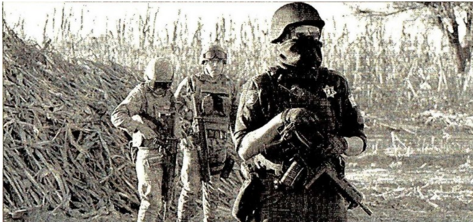
▲ Miembros de seguridad vigilan la zona en la que se desplomó el helicóptero que transportaba a la gobernadora de Puebla, Martha Érika Alonso, y al senador Rafael Moreno Valle.