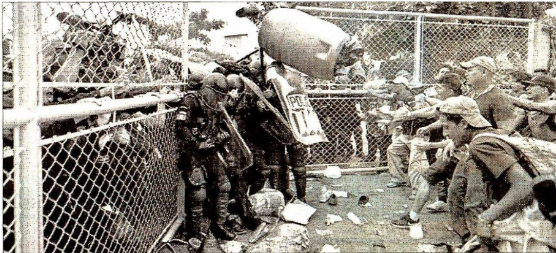
▲ La policía antidisturbios de Guatemala pretendió frenar sin éxito a migrantes que intentan cruzar el puente fronterizo internacional Guatemala-México en Tecún Umán.