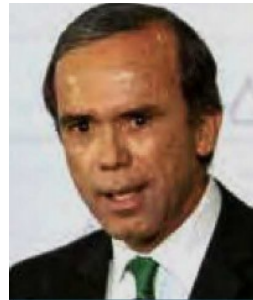
BOSCO DE LA VEGA