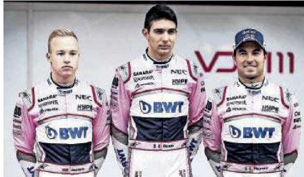
Sergio Checo Pérez (derecha)