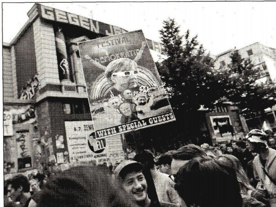
A unos días de la reunión del G20, decenas de manifestantes protestaron contra la cita de gobernantes de los países del bloque, entre ellos la canciller alemana, Angela Merkel, durante lo que denominaron “festival de la democracia con invitados especiales al baile de protesta”, ayer frente al centro cultural Rote Flora, en Hamburgo