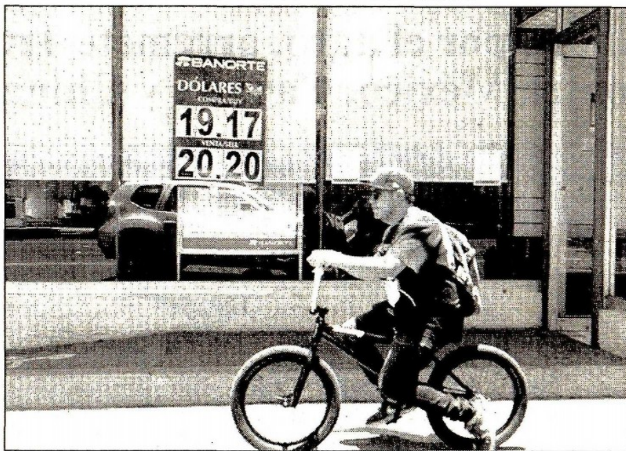
El peso perdió ayer al superar la barrera de 20 por dólar, en medio de un entorno de pesimismo por el futuro de las renegociaciones del Tratado de Libre Comercio de América del Norte. Al mayoreo se depreció 0.55 por ciento, a 20.02 unidades por billete verde, según el Banco de México. En ventanillas bancarias se vendió hasta en 20.30, de acuerdo con Citibanamex. En la imagen, un grupo financiero da a conocer la cotización de la moneda en Ciudad de México (Con información de Notimex y la Redacción)

D.R. cfvmexico_sa@hotmail.com • Twitter: @cafevega