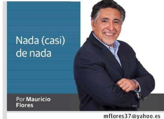
Por Mauricio Flores