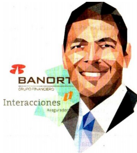
Carlos Hank González Jr.