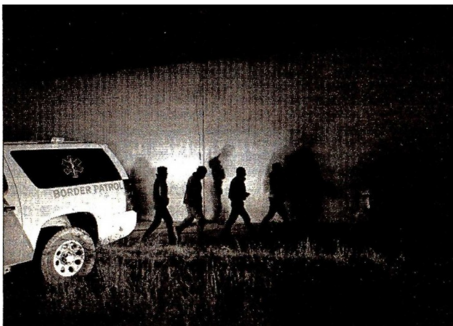
Inmigrantes indocumentados fueron capturados por agentes de la Patrulla Fronteriza y son custodiados mientras caminan frente al muro cerca de McAllen, Texas. Según cifras del Banco de México, en enero pasado se crearon 80 mil 860 empleos entre el grupo de migrantes mexicanos sin ciudadanía estadounidense

Twitter: @cafevega • cfvmexico_sa@hotmail.com