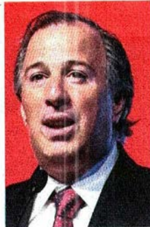
José Antonio Meade