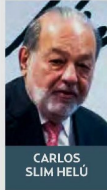
CARLOS SLIM HELÚ