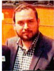
TOMADA DE VIDEO