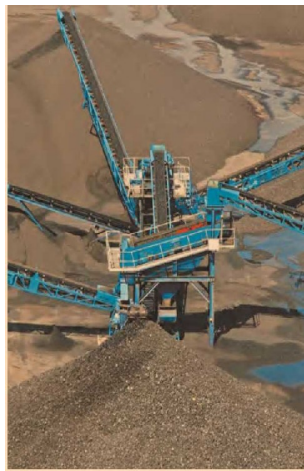
Coahuila es un estado altamente proveedor de carbón al mercado mexicano e internacional.

Coahuila ocupa el primer lugar nacional aportando el 98% del volumen y se estima que el 39% de la producción es de carbón térmico (la tercera parte la generan pequeñas productoras), el 47% es de carbón coquizable y el 14% restante lo genera el carbón lavado. La mayor veta de carbón en Coahuila se ubica en los municipios de Múzquiz, Sabinas, Juárez y San Juan de Sabinas. La producción de carbón se concentra en: Mi-