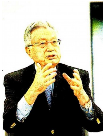
Secretario de Gobernación en 1988.