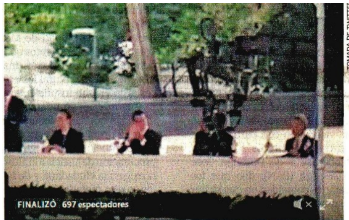
Imagen de la transmisión realizada por el senador Lozano