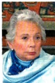
Olga Sánchez Cordero

lo deben integrar, con qué frecuencia deben reunirse y qué metodología utilizar. La idea en principio sería contar con un grupo colegiado experto que defina en qué etapa del ciclo económico se encuentra el país, similar a la a la Oficina Nacional de Investigación Económica (NBER, por sus siglas en inglés) de Estados Unidos. Nos comentan que el grupo convocado por Santaella realizó este trabajo a lo largo del segundo semestre del año pasado.