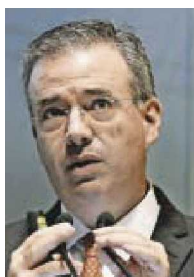
Alejandro Díaz de León

mandato que terminaría en 2022. Su salida anticipada responde a que irá a un fondo de inversión en infraestructura para países en desarrollo, pero nos dicen que el hecho sacude a Washington, pues el nombramiento de su sucesor debe hacerse lo antes posible para contar con un nuevo presidente en la próxima Reunión de Primavera del BM, a celebrarse en abril.