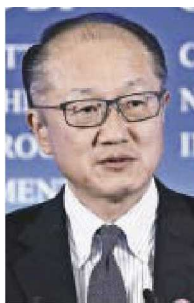
Jim Yong Kim