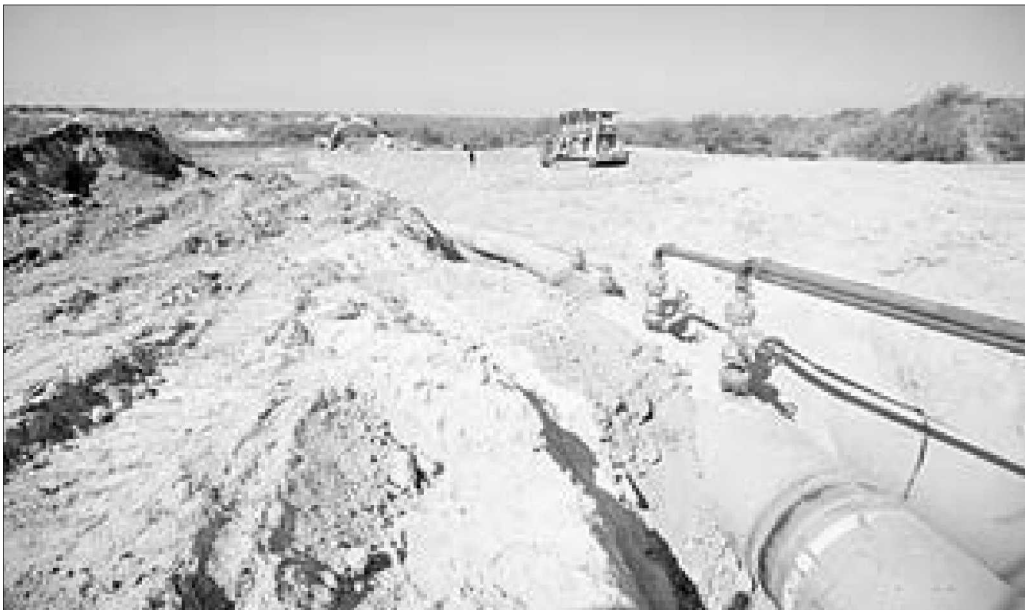
Gasoducto en el estado de Guanajuato.