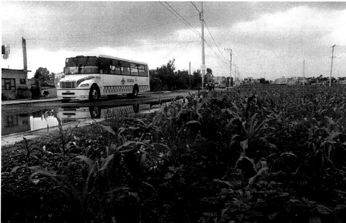
Hay 6 millones de hectáreas que no se utilizan, refirió.

“Ya no le invierten al campo por falta de recursos o porque es difícil recuperarlos”