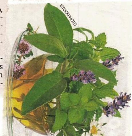
La industria herbolaria sigue en su lucha por formalizarse.

mil artesanos cuentan con un empleo gracias a la industria herbolaria.