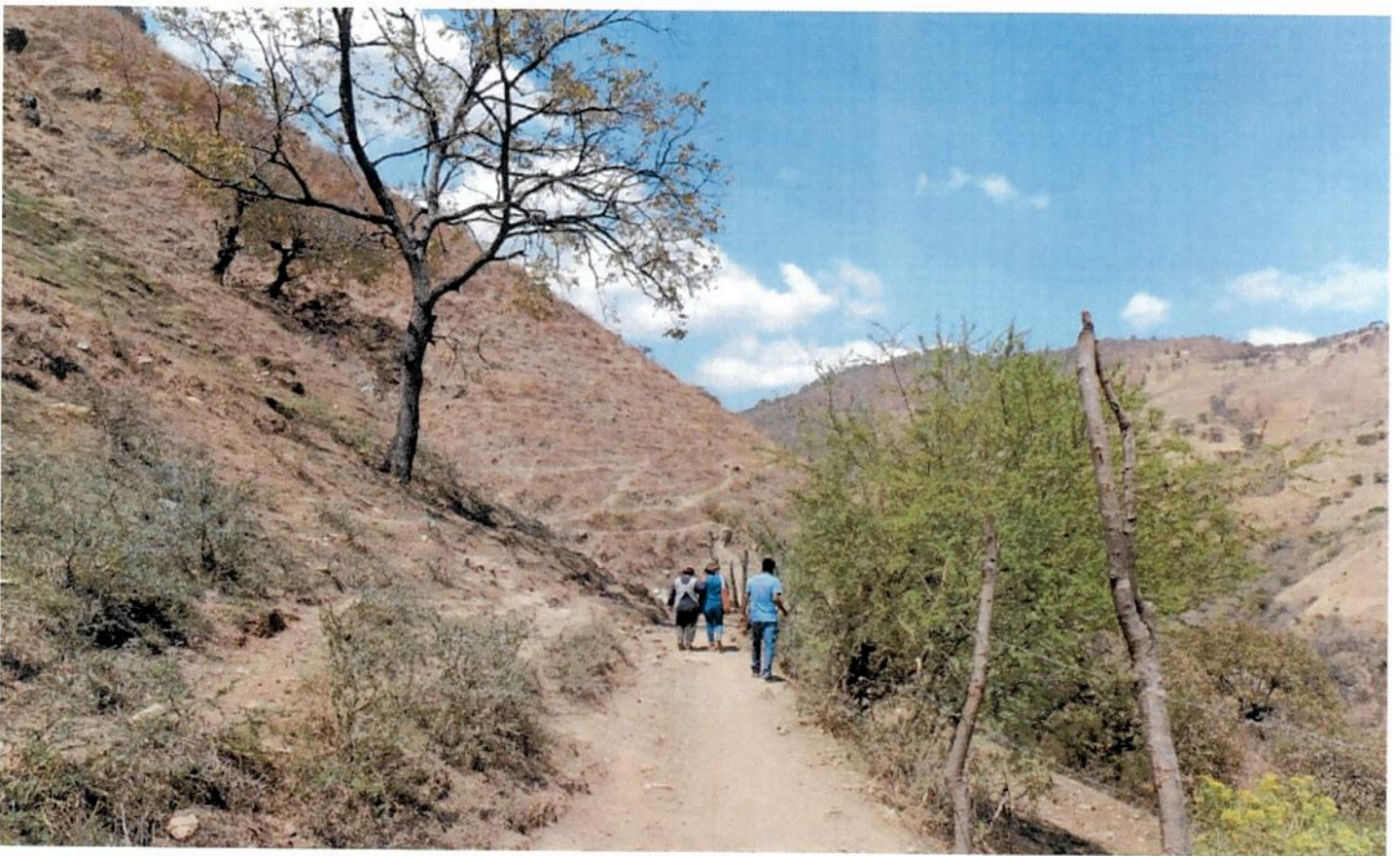
► Campos devastados. En los árboles sobrevivientes despuntan, enfermizas, unas cuantas hojas salpicadas de quemaduras blancas