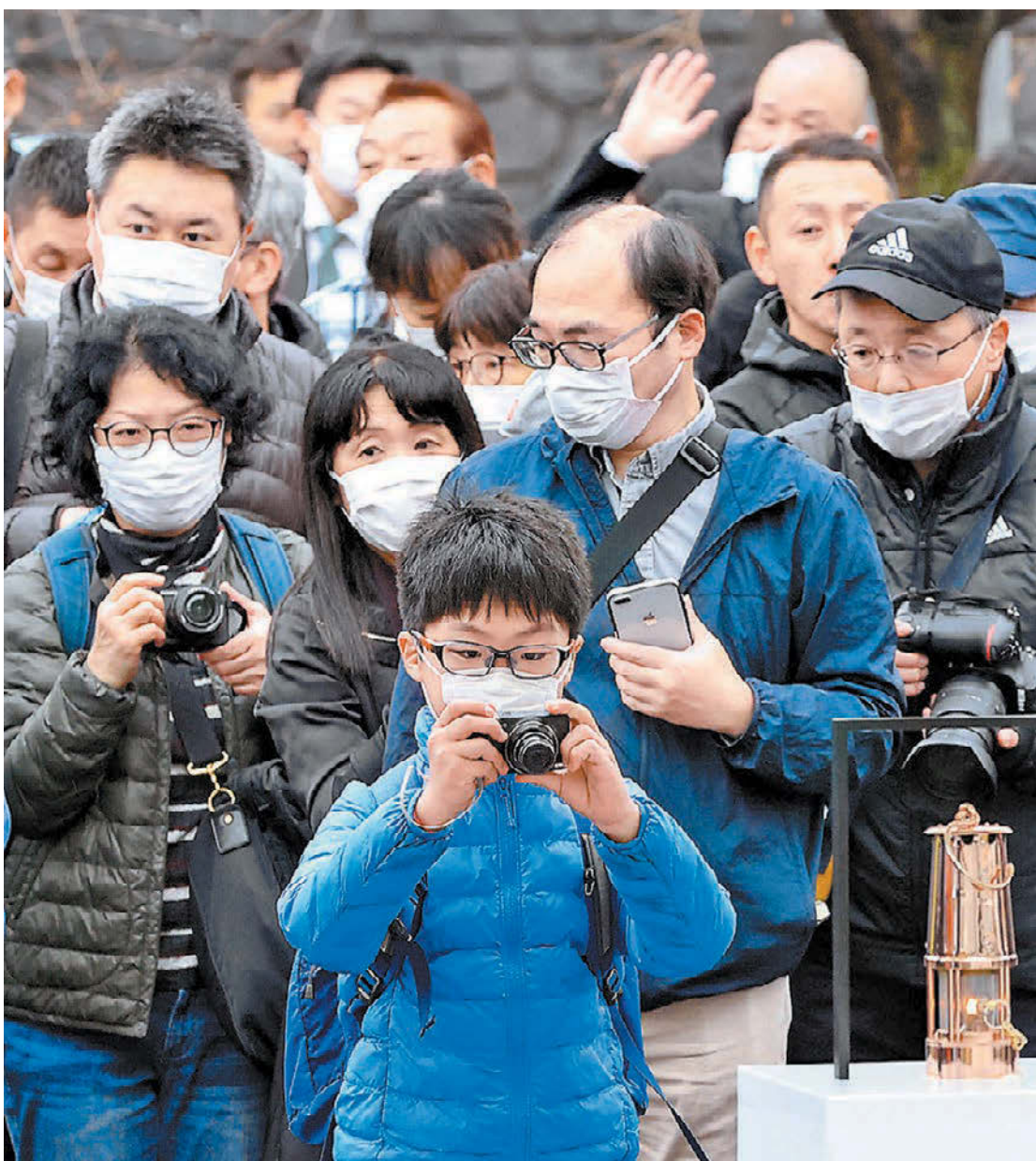
Con la llama olímpica en Japón, varios países exigen al COI posponer dos años la justa.